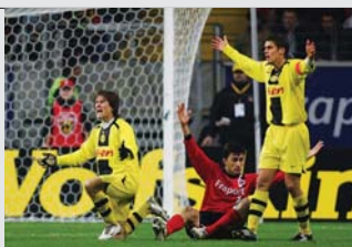
16. Spieltag 10.12.2005 Frankfurt – BVB 2:0

Das Kapitalmanagement der Geschäftsführung umfasst neben der Sicherung des nach den HGB-Vorschriften ermittelten Eigenkapitals der KGaA auch die Stabilisierung und Erhöhung des Eigenkapitals des nach den IFRS-Vorschriften ermittelten Konzerneigenkapitals. Diese Ziele werden wir insbesondere durch eine Verbesserung des operativen Ergebnisses und effektive Investitionen erreichen.