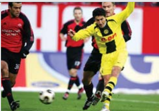
Ein Zeitdokument: Nuri Sahin verewigt sich mit diesem Schuss in den Geschichtsbüchern der Bundesliga.