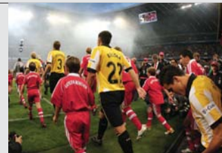
Borussia Dortmund bestritt am 11. August das Auftaktspiel beim FC Bayern München – und verlor es mit 0:2.