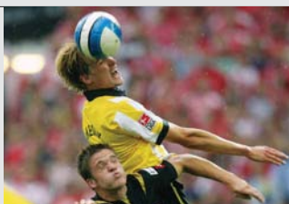
2. Spieltag 19.08.2006 BVB – Mainz 1:1

Die Ertrags-, Finanz- und Vermögenslage von Borussia Dortmund könnte durch die im Folgenden aufgeführten Risiken negativ beeinflusst werden. Hierbei ist zu berücksichtigen, dass das Unternehmensumfeld auch durch eine Vielzahl volkswirtschaftlicher Unwägbarkeiten wie bspw. einem geringem Wirtschaftswachstum, hoher Arbeitslosigkeit insbesondere im Ruhrgebiet oder einem erhöhten Wettbewerbsdruck in der Region geprägt wird. Unter Berücksichtigung aller Chancen- und Risikofaktoren passt die Geschäftsführung von Borussia Dortmund sowohl ihre kurzfristige Unternehmensplanung als auch ihre mittel- und langfristige Geschäftsstrategie laufend an.