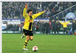
Sololauf ins Glück: Tomas Rosicky und die BVB-Bank (im Hintergrund) bejubeln ein Tor, das erst noch fällt...