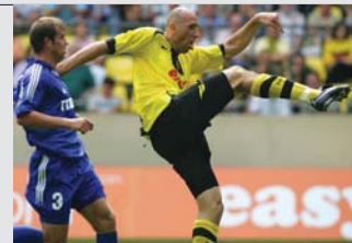
Das enttäuschende torlose Remis beim tschechischen Vertreter in Olmütz bedeutete das Aus im UI-Cup.