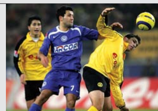
13. Spieltag 19.11.2005 BVB – Berlin 2:0

Duell der Nachwuchs-Stars: Leverkusens Castro lässt David Odonkor auf die nicht ganz feine Art aussteigen...