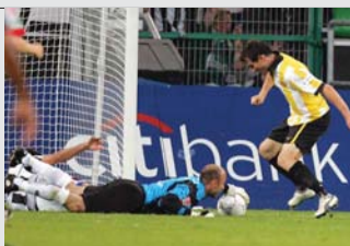
Frei zum Zweiten: Keller angelt dem BVB-Stürmer den Ball vom Fuß.

Die in den vergangenen Jahren bestehende Bestandsgefährdung dürfte damit endgültig überwunden sein.