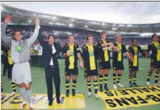
So feierte die Mannschaft mit ihren Fans den Sieg in Stuttgart.