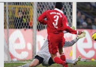
17. Spieltag 17.12.2005 BVB – München 1:2