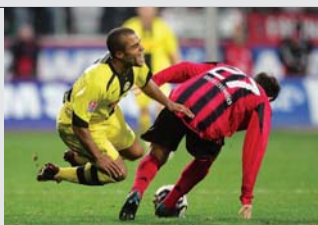
12. Spieltag 5.11.2005 Leverkusen – BVB 2:1

Der Anteil der Werbung am Gesamtertrag lag in der Saison 2004/2005 bei 27,43 Prozent, ein Wert, der sich gegenüber 2003/2004 (29,25 Prozent) und 2002/2003 (27,87 Prozent) nur leicht verändert hat. Was für den Lizenz-Fußball insgesamt gilt, gilt natürlich auch für die Bundesliga für sich betrachtet: € 357,5 Millionen nahmen die 18 Top-Clubs im Bereich Sponsoring ein, ebenfalls ein neuer Höchststand. Im Vergleich zur Saison 2003/2004 konnte die höchste Spielklasse ihren Werbe-Ertrag um 7,44 Prozent steigern.