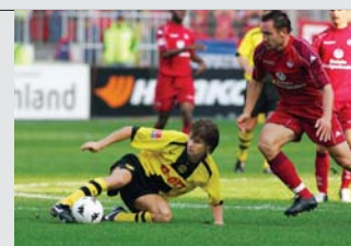
9. Spieltag 15.10.2005 K'lautern – BVB 3:3

Kaum ein Durchkommen gegen Stuttgarts engmaschiges Defensivnetz gab es für den BVB (Rosicky gegen Soldo).