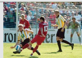
DFB-Pokal 9.09.2006 Thannhausen – BVB 0:3

Die TSG Thannhausen spielte viele Chancen heraus.