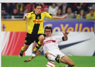
8. Spieltag 2.10.2005 BVB – Stuttgart 0:0

Kaum ein Durchkommen gegen Stuttgarts engmaschiges Defensivnetz gab es für den BVB (Rosicky gegen Soldo).