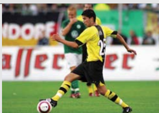
Bundesliga-Debüt mit 16 Jahren und 335 Tagen: Nuri Sahin, jüngster Spieler aller Zeiten.

Auch als Werbeumfeld hat die Bundesliga nichts an Strahlkraft eingebüßt. Im Gegenteil können die Vereine beim Sponsoring, genau wie bei den übrigen Erlösquellen, auf eine erfolgreiche Saison mit abermals gestiegenen Einnahmen zurückblicken.