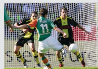
5. Spieltag 17.09.2005 Bremen – BVB 3:2